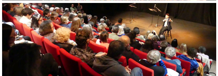
Représentation au Strapontin à Issoire 24 mars 2026