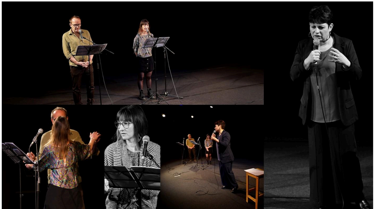
Séance de répétition à la Salle du Strapontin à Issoire

Tout sauf le silence, c'est un temps qui donne à apprendre, un moment d'écoute et de réflexion, un espace de transmission sur un sujet souvent tu, qui concerne pourtant chacun de nous